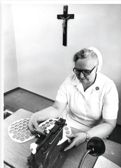
Diakonisser på arbejde. Cyklen er udskiftet med bil og til højre udstandses der alterbrød.

også deres kvaler, fordi diakonisserne ikke skulle gå hen og føle sig som noget særligt. Omvendt var det diakonien, der drev dem, og derfor var de svære at placere i det kirkelige univers. Og endelig har der altid været mænd, der bare er blevet provokeret af fravalget af mand og børn. De har tilsyneladende også levet fint uden. Der er ikke noget, der tyder på, at diakonisserne har lidt under ikke at være gift, og ægteskabet var sjældent grunden til, at de valgte at udtræde.”