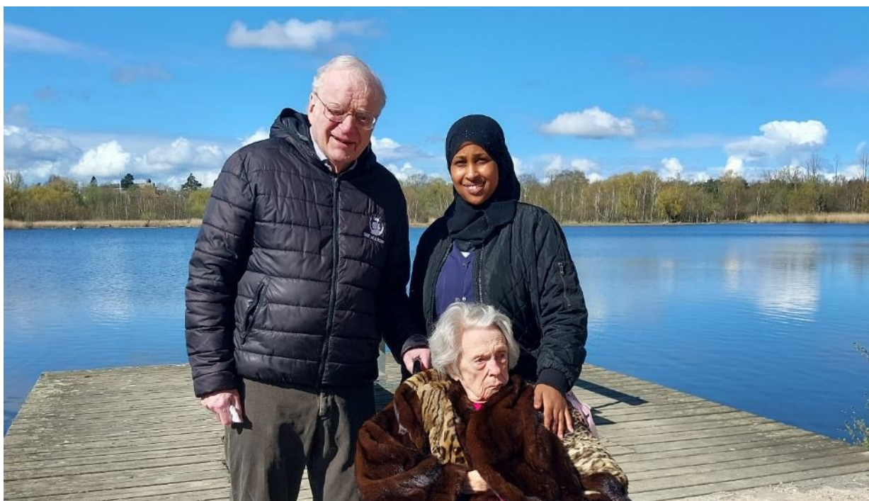
Gåtur i flot aprilvejr