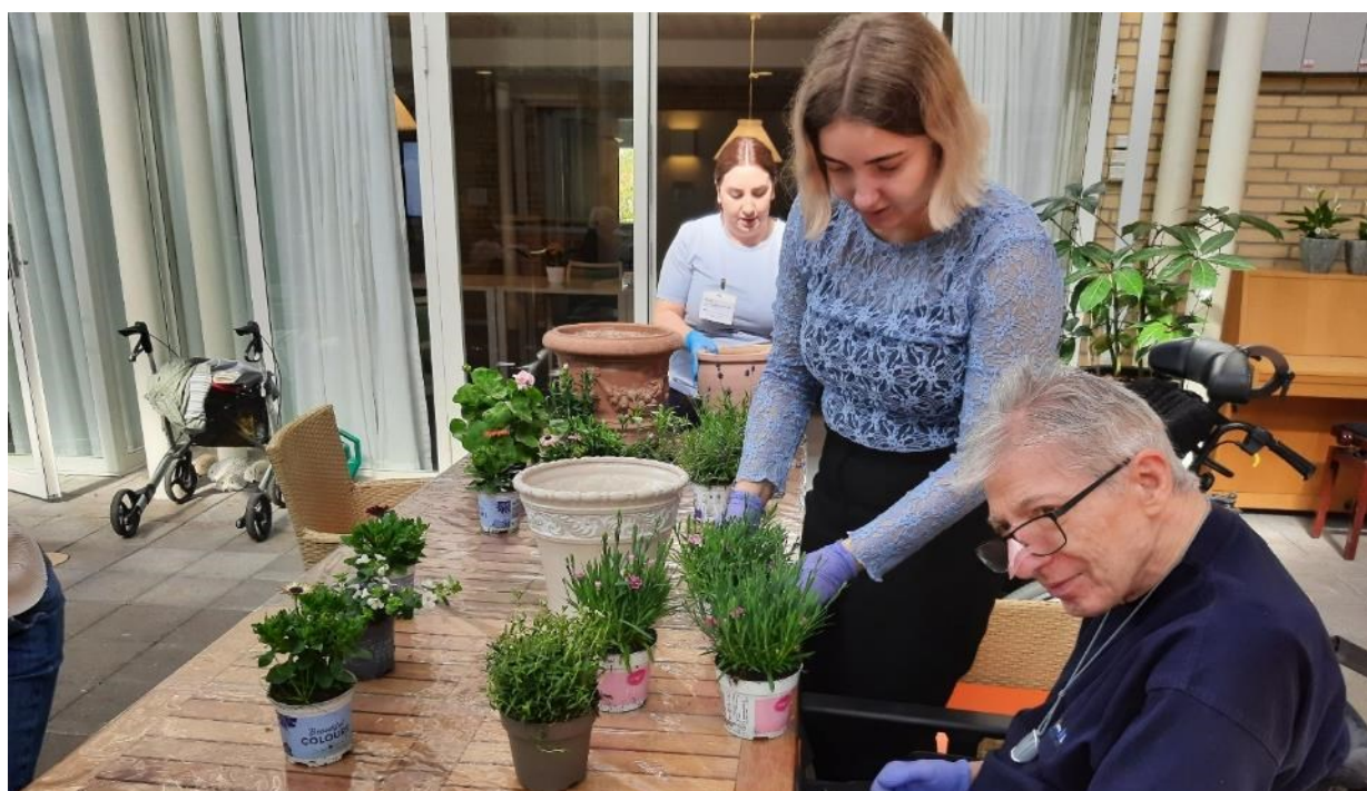
Plantedag med beboere og pårørende