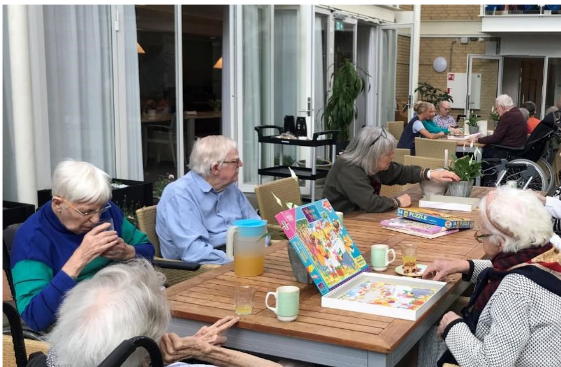
Eftermiddag med kaffe, hygge, samtaler og puslespil.