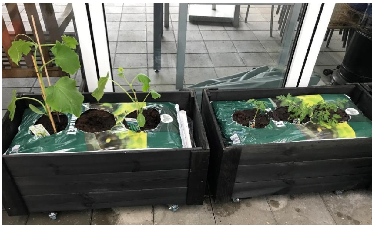
Agurke- og tomatplanter sået i kapilær-kasser.